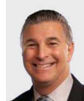
Foster R. Malmed D.C., P.C.